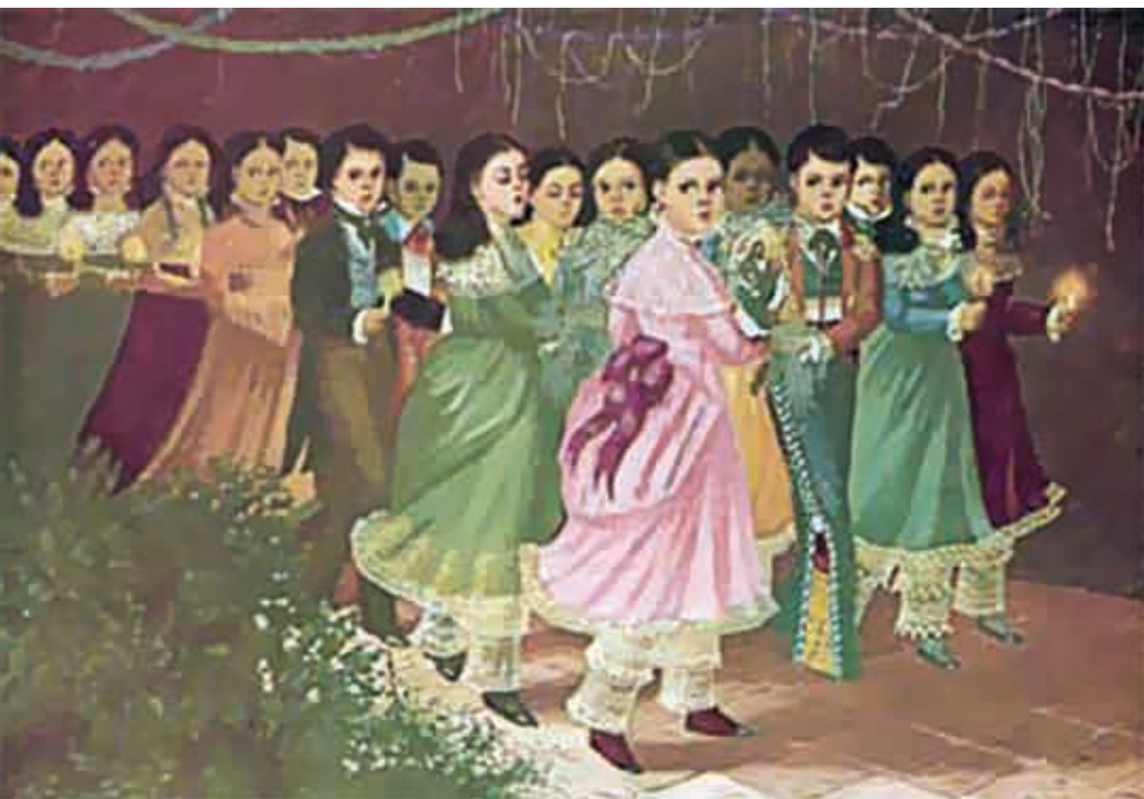
Niños mexicanos S. XIX.

Insistimos, la época de retroceso aludida no puede ser otra que aquella del dominio eclesiástico, pero también de la inestabilidad política de la primera mitad del México independiente, por lo que se aplicaría aquí el refrán de que "todo depende del color del cristal con que se mira". Sea como fuere, la nostalgia por esos tiempos idos es constante y así lo confirma El Monitor Republicano del 28 de diciembre de 1873 en una nota aún más conservadora: