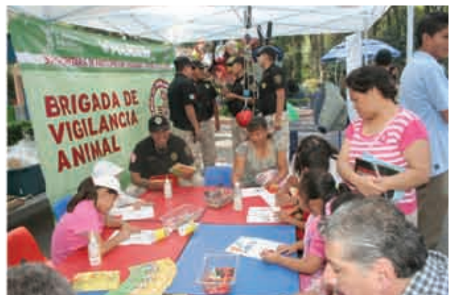
La brigada brinda asesoría e información a la población.