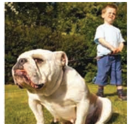
Hay evidencia que los niños que maltratan a los animales han sufrido violencia intrafamiliar.