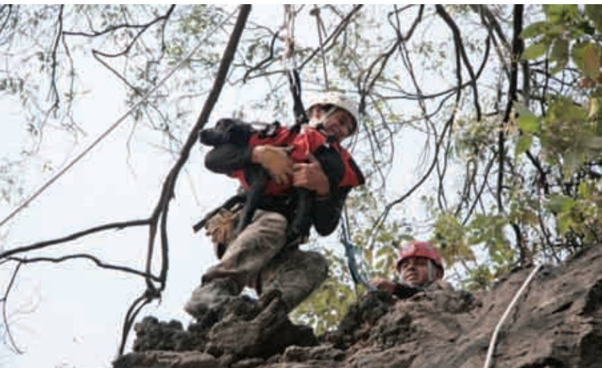
Uno de los objetivos del programa es rescatar animales de vías primarias y secundarias.