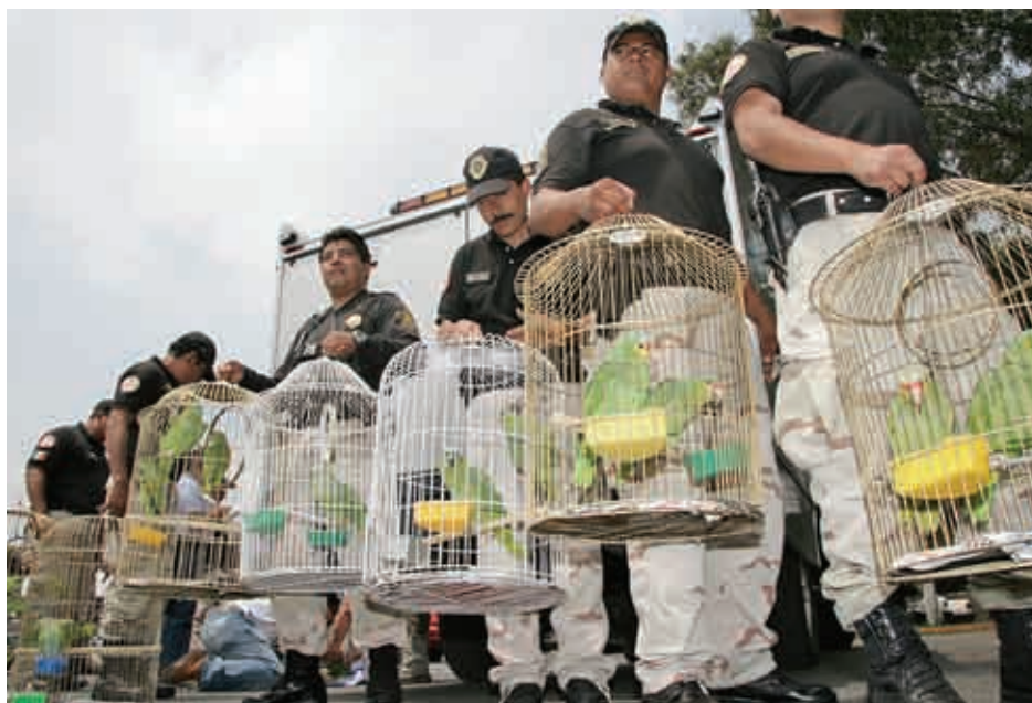
20 pericos atoleros fueron rescatados.