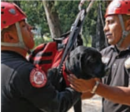
En el D.F. la Ley de Protección a los Animales, tiene por objeto protegerlos.